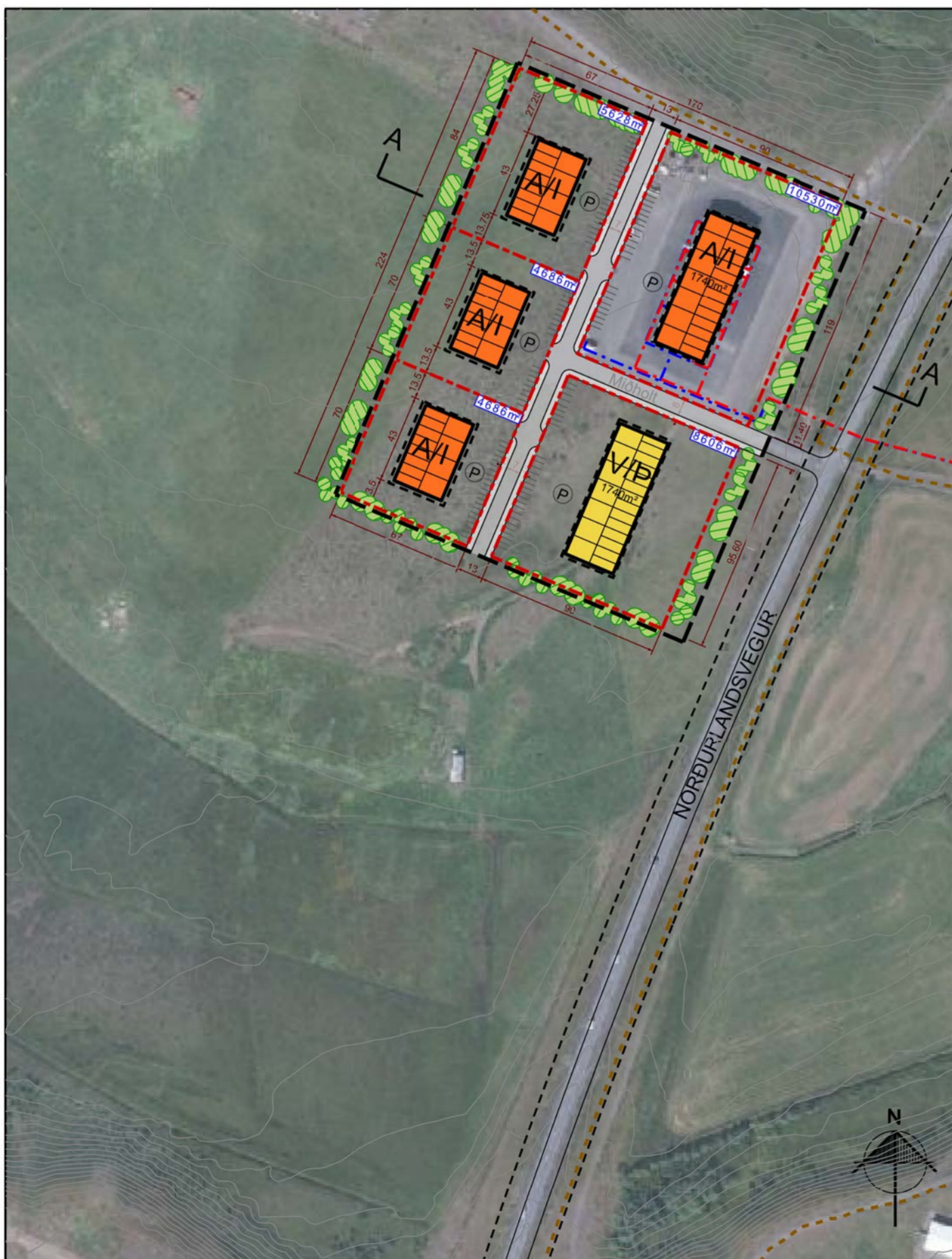
Tillaga að breytingu á deiliskipulagi í febrúar 2024. Mkv. 1: 2500