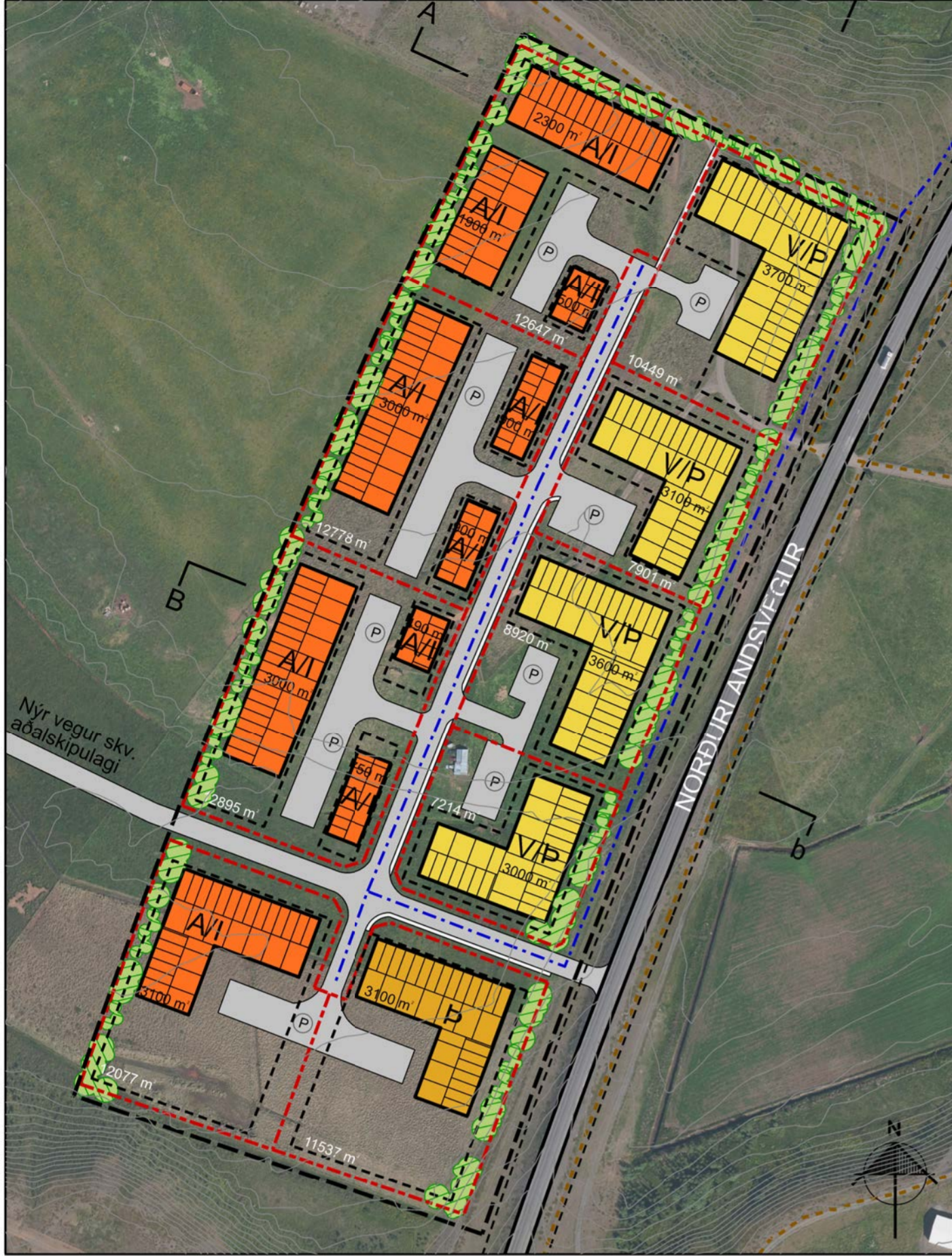
Gildandi deiliskipulag frá 09.09.2014, m.s.br. 12.11.2014 Mkv. 1: 2500

Breyting á deiliskipulagi við Norðurlandsveg