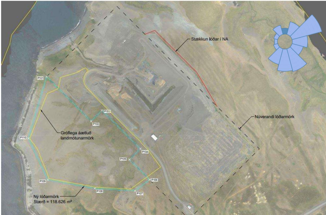
Mynd 56. Afmörkun á svæði sem fyrirhugað er fyrir landmótun auk nýrra lóðarmarka. Vindrós sýnir ríkjandi vindáttir á svæðinu (Veðurstofa Íslands).