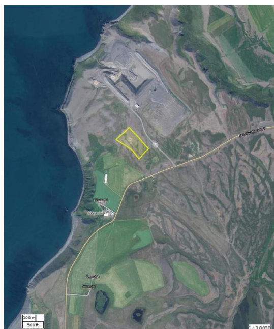
Mynd 76. Loftmynd sem sýnir staðsetningu fyrirhugaðs nýs efnistökusvæðis í landi Sölvabakka.

Landeigendur Sölvabakka hafa óskað eftir að nýju efnistökusvæði verði bætt inn á aðalskipulag, suður af núverandi úrgangslausunar- og efnistökusvæði Ú1/E4, en um er að ræða efnisvinnslu til hörpunar og flokkunar. Gert er ráð fyrir 45.000 m 3 efnistöku að hámarki á svæðinu sem er 2,3 ha að stærð. Efnid verður flokkað og selt sem drenmöl, lagnasandur, vegagerðarefni o.fl. Grófleiki efnisins finnst ekki í öðrum námum á svæðinu. Efnistakan fellur í C-flokk laga um mat á umhverfisáhrifum nr. 106/2000.