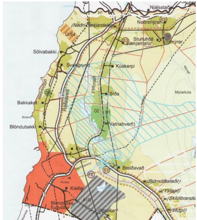
Mynd 1. Hluti gildandi aðalskipulags Blönduóbæjar 2010-2030.

Við skipulagsgerð sveitarfélaga verði leitast við að varðveita náttúru- og menningargæði sem hafa staðbundið, eða víðtækara, gildi út frá sögu, náttúruferi eða menningu. Það getur m.a. falist í stefnu um vistheimt og verndun og eflingu gróðurs og jarðvegs. Jafnframt verði gætt að álagi á vatn og vatnsvernd. Landslagsgreining og vistgerðaflokkun ásamt áætlunum um uppgræðslu lands og vatnaáætlun verði lagðar til grundvallar skipulagsákvörðunum.